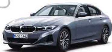
BMW 320i Exclusive

8速AT 4ドア右ハンドル ボディカラー/スカイスクリューグレー 6,860,000円 全長×全幅×全高: 4,720×1,825×1,440mm