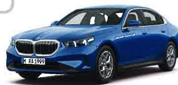
BMW 523i Exclusive

8速AT 4ドア右ハンドル ボディカラー/ファイトニックブルー 7,980,000円 全長×全幅×全高: 5,060×1,900×1,515mm