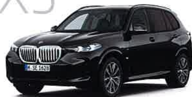
BMW X5 xDrive40d M Sport

8速スポーツAT 5ドア右ハンドル ボディカラー/ブラック・サファイア 12,900,000円 全長×全幅×全高: 4,935×2,005×1,770mm