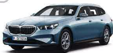
New BMW 523d xDrive Touring Exclusive

8速AT 5ドア右ハンドル ボディカラー/ケープ・ヨーク・グリーン 8,900,000円 全長×全幅×全高: 5,060×1,900×1,515mm