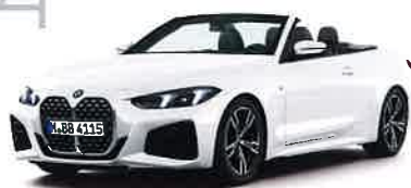
New BMW 420i Cabriolet M Sport

8速スポーツAT 2ドア右ハンドル ボディカラー/アルビノ・ホワイイト 7,760,000円 全長×全幅×全高: 4,775×1,850×1,395mm