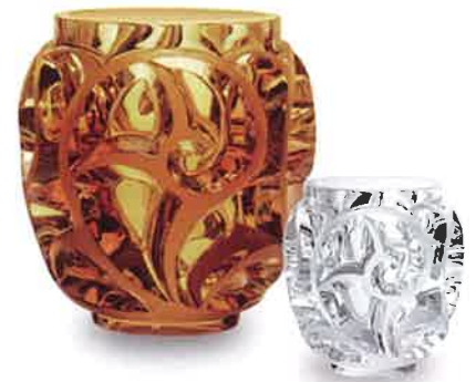
《シャンゼリゼ》ボウル

1926年、ルネ・ラリックによってシダの花をモチーフにデザインされ、ラリックのアイコンックピースとなった《トゥールビヨン》。時代を超え、タイムレスな装飾美と洗練で、見る人を惹きつけてやみません。