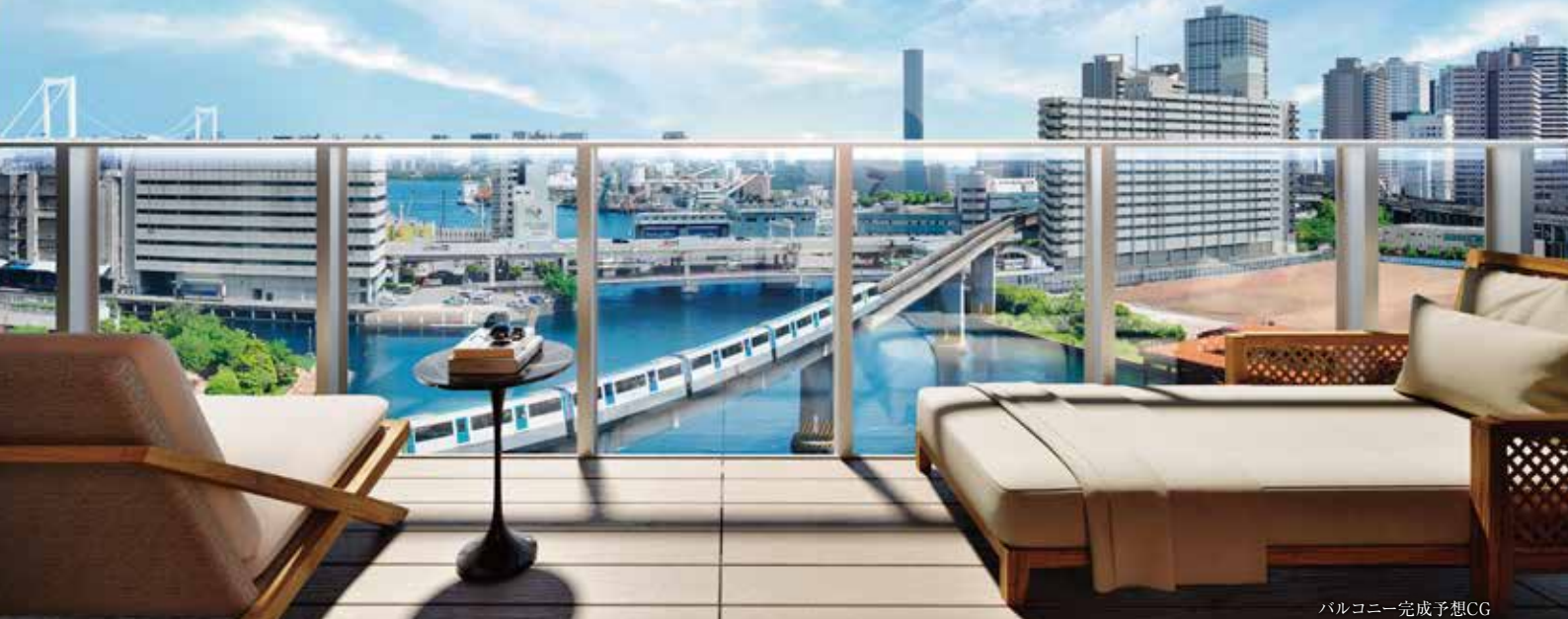
バルコニー完成予想CG

※掲載のバルコニー完成予想CGは計画段階のEタイプ図面を基に描き起こしたもので、形状、色味等は実際とは異なります。また、有償オプションの他、家具・備品等は販売価額には含まれておりません。現地12階相当の高さより南東方向を撮影(2024年5月)した写真をCG加工したもので、実際とは異なります。また、周辺環境、眺望は将来にわたり保証されるものではありません。