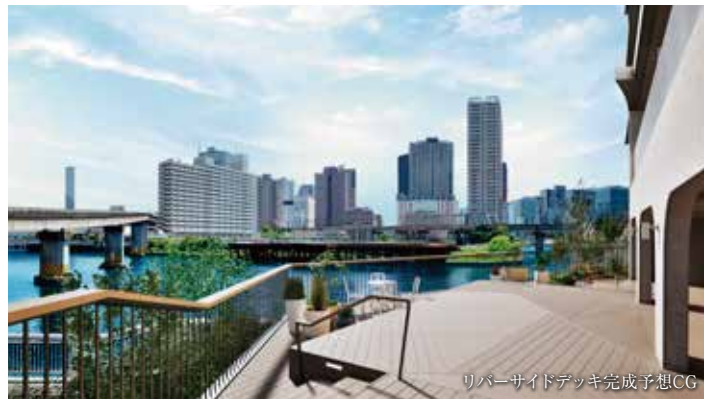
リバーサイドデッキ完成予想CG

※1 4駅5路線利用可とは、京急線・都営浅草線「泉岳寺」駅、JR山手線・京浜東北線「田町駅」・「高輪ゲートウェイ駅」、都営三田線「三田駅」の利用が可能であることを示します。※掲載の外観完成予想CGは現地南東約50mの地点・約1mの高さより現地方向を撮影した写真(2024年5月撮影)に計画段階の図面を基に描き起こした建物完成予想図を合成し、CG加工したもので、実際とは異なります。また、変更となる場合がございます。エントランスホール・リバーサイドデッキ完成予想CGは計画段階の図面を基に描き起こしたもので、実際とは異なります。また、変更となる場合がございます。雨樋、給気口、スリーブ等、一部再現されていない設備機器がございます。また、タイル・石貼等の大きさは実際とは異なります。