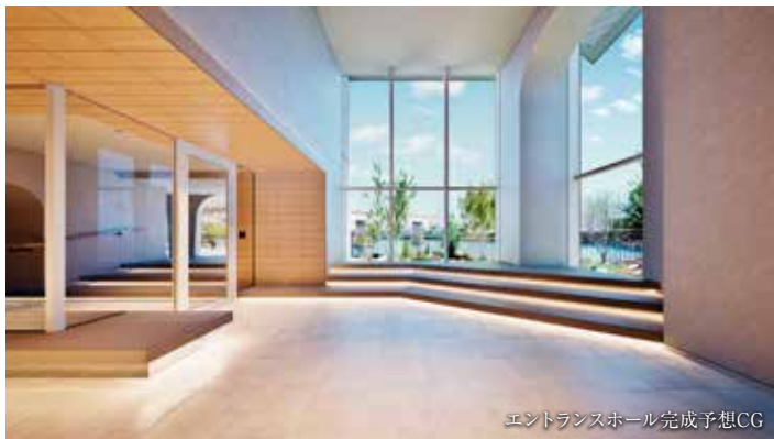
エントランスホール完成予想CG