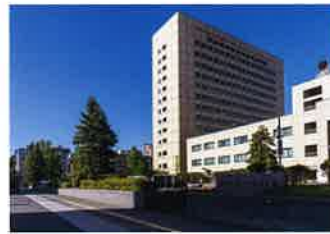
札幌医科大学附属病院(約550m/徒歩7分)