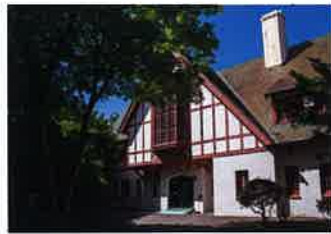
北海道知事公館(約540m/徒歩7分)