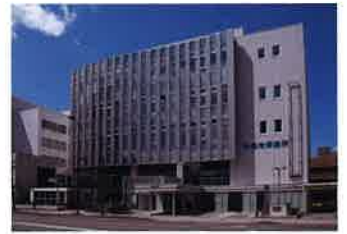
WEST19(夜間急病センター)(約160m/徒歩2分)

■物件共通概要●物件名/ザ・レーベン札幌大通 MASTERS ONE●所在地/北海道札幌市中央区大通西十八丁目2番3、2番27(地番)●交通/札幌市営地下鉄東西線「西18丁目」駅徒歩1分 ※3番出入口●用途地域/商業地域●敷地面積/1,336.92m 2 ●構造・規模/鉄筋コンクリート造地上17階建●総戸数/76戸(他、管理事務室1戸、コワーキングスペース3戸)●駐車場/41台(機械式36台、平置4台、車いす使用者優先平置1台)月額使用料:13,000円~20,000円●駐輪場/21台(スライドラック式平置20台、3人乗対応平置1台)月額使用料:200円~400円、他、レンタサイクル3台●建物竣工年月/2025年2月下旬(予定)●引渡可能年月/2025年3月下旬(予定)●施工会社/株式会社浅沼組●分譲後の権利形態/敷地:専有面積割合による所有権の共有 建物:専有部分は区分所有権、共用部分は専有面積による所有権の共有●管理形態/区分所有者全員で管理組合結成後、管理会社に委託(通勤)●建築確認番号/第ERI-22049314号(2023年2月22日付)●売主/株式会社タカラレーベン●管理会社/株式会社レーベンコミュニティ ※掲載の外観完成予想CGは計画段階の図面を基に描き起こしたもので実際とは異なります。なお、外観の細部及び設備機器等は一部省略又は簡略化しております。建物の形状が分かりやすいよう周辺建物等を透過して描いております。掲載は計画段階のもので変更となる場合があります。※掲載の環境写真は2017年9月、2019年10月、2023年5月に撮影したものです。※掲載の距離は現地からの概算距離です。※徒歩分は1分を80mで算出し、端数を切り上げたものです。※掲載の所要時間は通算時のもので時間帯により異なります。また乗り換え・待ち時間を含みます。※「ゾルダン乗換案内」調べ。(2023年4月時点)