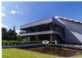
北海道立近代美術館(約410m/徒歩6分)