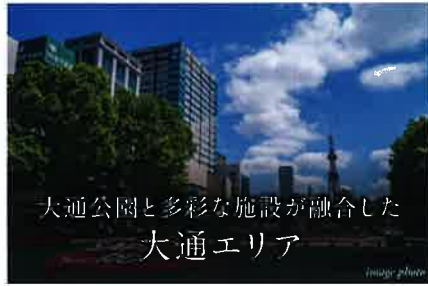
大通公園と多彩な施設が融合した 大通エリア

「円山公園」駅へ 1 min. Maruyama Koen Sta. 「西18丁目」駅より札幌市営地下鉄東西線利用