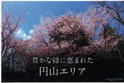
豊かな緑に恵まれた 円山エリア

「円山公園」駅へ 1 min. Maruyama Koen Sta. 「西18丁目」駅より札幌市営地下鉄東西線利用