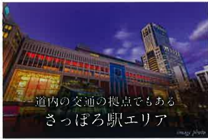
道内の交通の拠点でもある さっぽろ駅エリア

「大通」駅へ 4 min. Odori Sta. 「西18丁目」駅より札幌市営地下鉄東西線利用