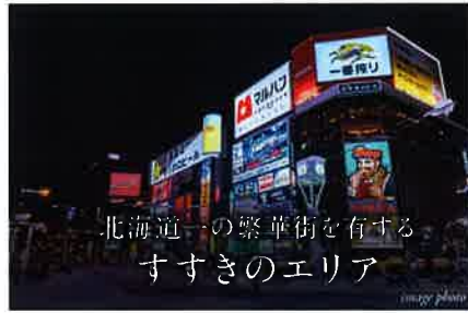
北海道一の繁華街を有する すすきのエリア

「さっぽろ」駅へ 8 min. Sapporo Sta. 「西18丁目」駅より札幌市営地下鉄東西線利用、 「大通」駅で札幌市営地下鉄南北線に乗り換